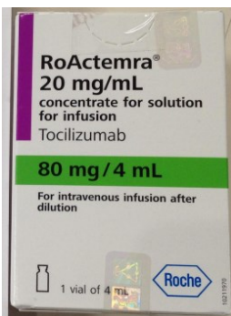
Photo du médicament importé

Nous vous demandons de les mettre à disposition IMPÉRATIVEMENT des professionnels de santé qui vont administrer le médicament aux patients