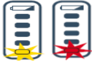
Figure 2 : Affichage de la charge de la batterie