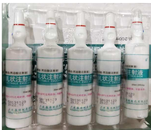
Etiquette d'ampoule :