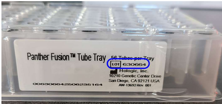
Figure 2. Emplacement du numéro de lot sur le plateau pour tubes Panther Fusion.