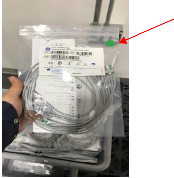
Bases de câbles et fouets de dérivation ECG emballés et non affectés