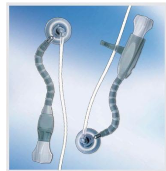
- Ventouses d'exposition XPOSE 3 et XPOSE 4 -