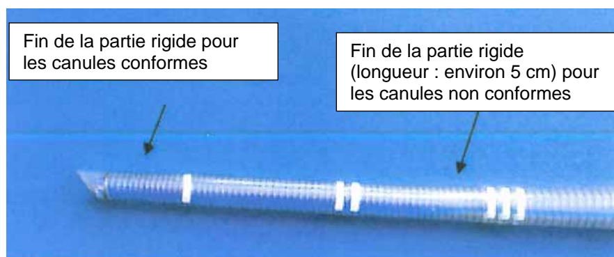
- Photo n°2 : Extrémité distale d'une canule artérielle pédiatrique -

Particulièrement attentif à la qualité et à la sécurité de ses produits, le fabricant MAQUET CARDIOPULMONARY AG a eu connaissance de deux événements relatifs au phénomène décrit ci-dessus. Aucune conséquence clinique n'a été rapportée à ce jour.