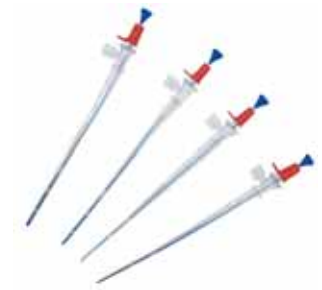
- Canules artérielles pédiatriques -