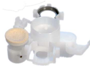
Recharge de membrane

Un problème de fabrication survenu sur certaines recharges de membranes, provoque l'absence d'électrolyte sous la membrane en cas d'utilisation d'un outil avec une recharge défectueuse. Une photo d'un capteur sans électrolyte figure ci-dessous :