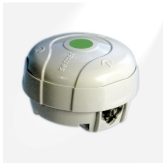
Outil de changement de membrane

L'outil de changement de membrane permet de changer la membrane et l'électrolyte du capteur V-Sign (se référer au Mode d'emploi du moniteur SenTec, pages 12 et 13). L'outil de changement de membrane peut être réutilisé en remplaçant la recharge contenant la membrane et l'électrolyte après utilisation.