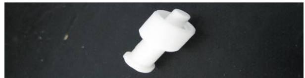
Fig. 3 : Bouchon hermétique