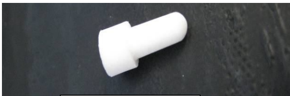
Fig. 1 : Bouchon obturateur

Sur les autres sets de pression LogiCal ® , un bouchon percé est inséré dans la voie latérale du robinet zéro (Fig. 2).