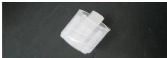
Fig. 2 : Bouchon percé