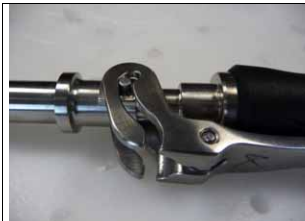
Fig. 2 : présence du pion permettant le fonctionnement de la poignée amovible