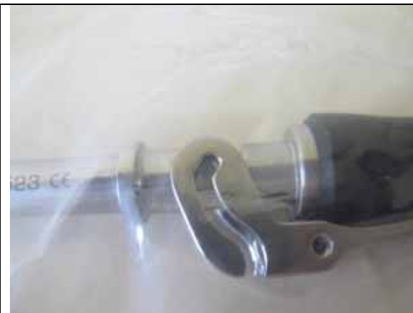
Fig. 3 : absence du pion