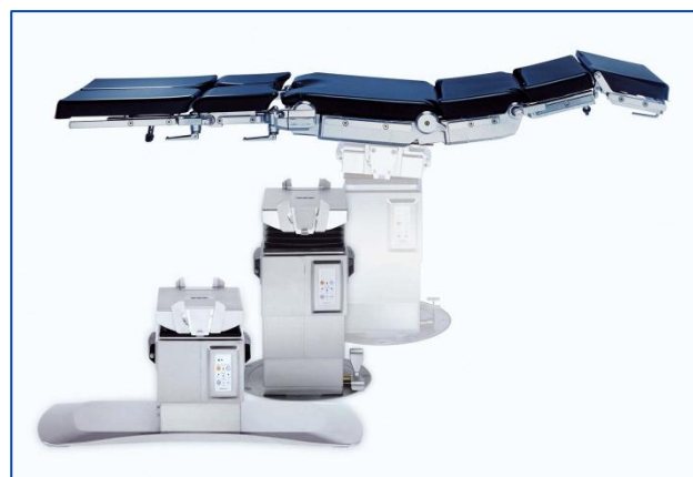
- Système de table d'opération OTESUS 1160.01 -