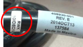
Image 2 câble d'alimentation correct, correspond à la période mentionnée avec marquage RWK