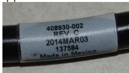
Image 1 mauvais assemblage du câble d'alimentation, correspond à la période mentionnée