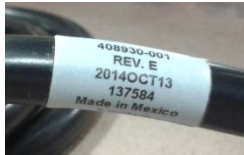
Image 1 câble d'alimentation défectueux, correspond à la période mentionnée