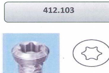
Figure 2 – Référence produit 412.103 Vis de verrouillage D 3.5mm à tête de vis en forme d'étoile