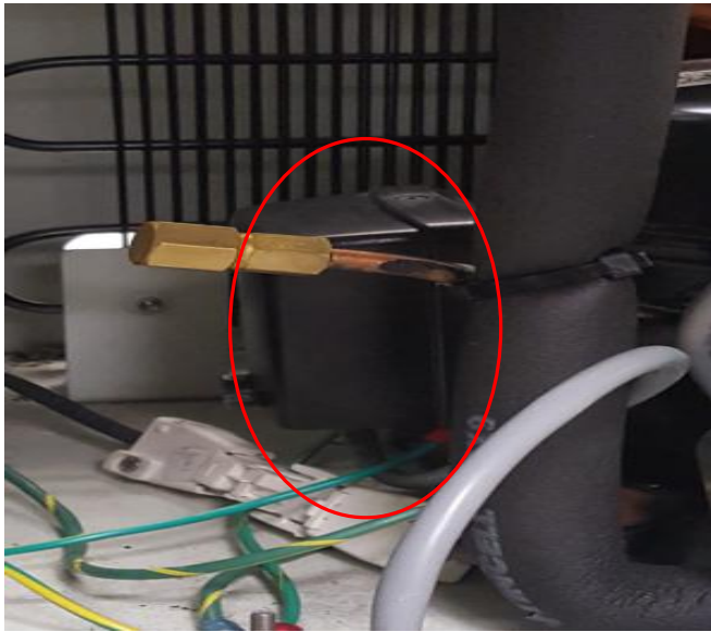
Figure 1. Cache en place