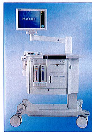
- Exemple de système d'anesthésie FLOW-i -