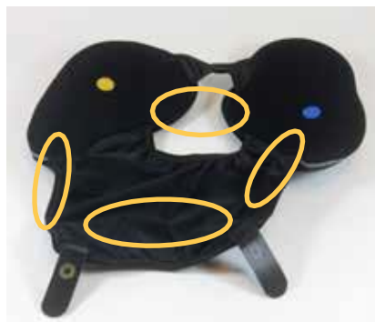
Rebound® Cartilage Wraparound