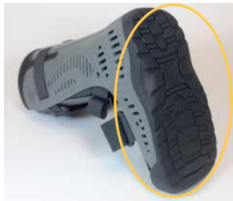
Rebound® Air Walker