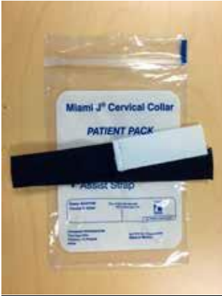
Miami J® Cervical Collars Assist Strap