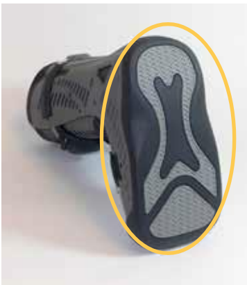
Rebound® Diabetic Walker