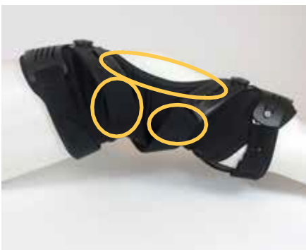
Rebound® Cartilage Wraparound