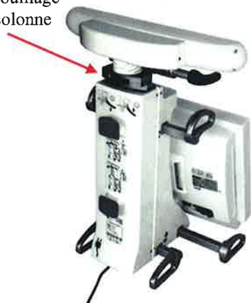
Colonne position basse

DANGER Montée brusque de la colonne télescopique au déverrouillage