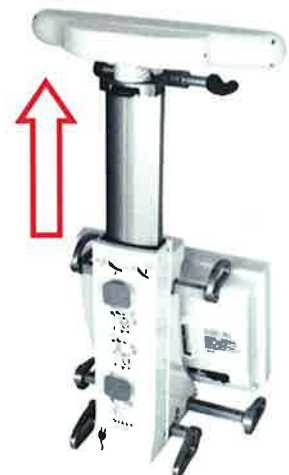
Colonne position haute

DANGER Montée brusque de la colonne télescopique au déverrouillage