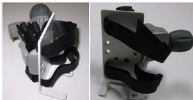
Figure 15-8 Support pour adaptateur de courant EV1000

Illustration de l'orientation de l'adaptateur électrique, extraite du manuel de l'utilisateur de l'EV1000A (figures 15-8 et 15-9)