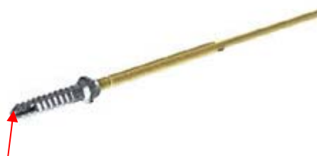
petite bavure à l'extrémité de la vis

MEDICREA a enregistré un incident concernant la vis pédiculaire polyaxiale canulée Ø5.5 X 45MM - PASSMIS référence B06015545 du lot 15E0371. Cet incident concerne l'impossibilité d'introduire la vis canulée sur l'axe guide. La présence d'une petite bavure à l'extrémité de la vis s'est repliée lors de l'opération de finition rétrécissant le diamètre de la canule.