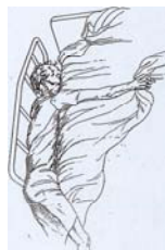
Entre le matelas et la barrière